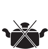
Посуда с выпуклым дном

Также вы можете воспользоваться специальной металлической подставкой (в комплект не входит), которая позволяет использовать на индукционной плитке несовместимую посуду.