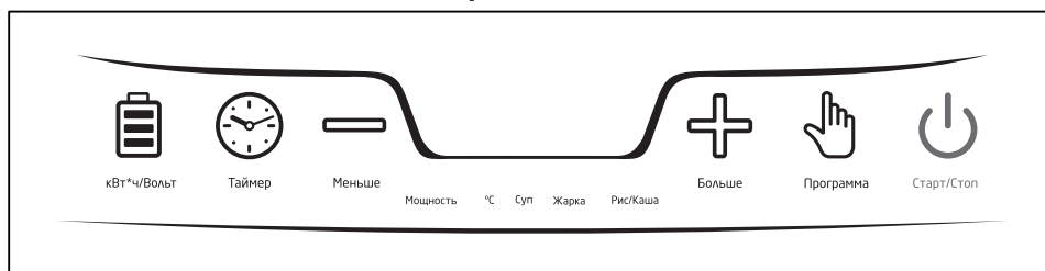
Схема расположения функциональных кнопок

Старт/Стоп — кнопка включения / выключения плиты.