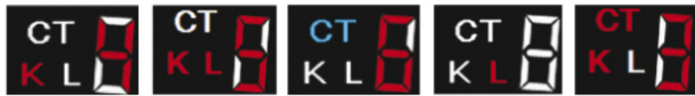
К-диапазон Ка-диапазон СТРЕЛКА ЛАЗЕР X-диапазон

Примеры таких оповещений о срабатывании на сигналы разных диапазонов приведены ниже: