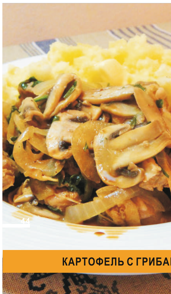
КАРТОФЕЛЬ С ГРИБАМИ