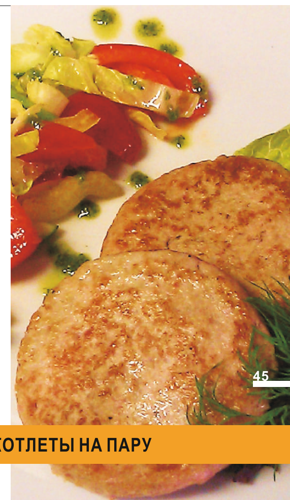
КОТЛЕТЫ НА ПАРУ