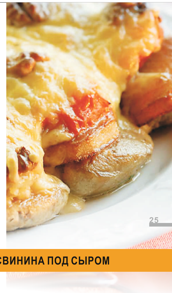
СВИНИНА ПОД СЫРОМ